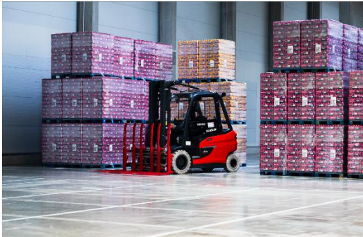
Foto: Spezialequipment: Für die Handhabung der bis zu 900 kg schweren Paletten kommen im Lager in Olching 8-Tonnen-Stapler zum Einsatz (Foto: Andreas Schmid Group).