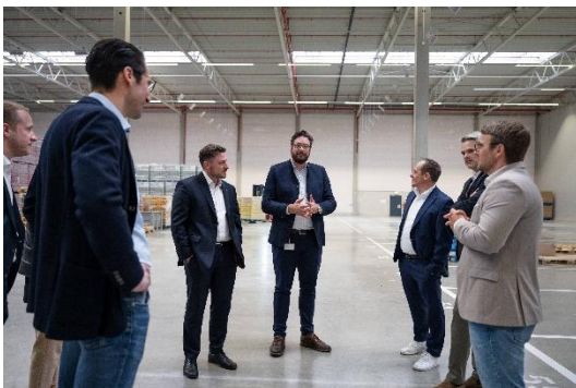
Foto: Das Handling der sensiblen Produkte erfordert eine enge Zusammenarbeit zwischen der Paulaner Brauerei Gruppe und der Andreas Schmid Group (Foto: Andreas Schmid Group).

Foto: Schwerkraft-Rollenbahn im Wareneingang und zur Einlagerung: Paletten mit Dosen werden im Lager in Olching effizient in Richtung Einlagerung transportiert (Foto: Andreas Schmid Group).